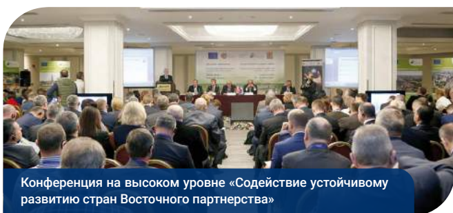
Конференция на высоком уровне «Содействие устойчивому развитию стран Восточного партнерства»

Спикеры подчеркнули важную роль местного самоуправления в процессе децентрализации, принятии институциональных, правовых реформ и в содействии местному устойчивому развитию. По их словам, Европейская комиссия вносит значительный вклад в поддержку местных и региональных органов власти стран Восточного партнерства, а также содействует расширению регионального сотрудничества и обмену опытом между муниципалитетами по всей территории Восточного партнерства.