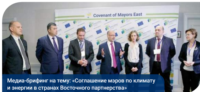
Медиа-брифинг на тему: «Соглашение мэров по климату и энергии в странах Восточного партнерства»

В рамках конференции также состоялся медиа-брифинг на тему: «Соглашение мэров по климату и энергии в странах Восточного партнерства», на котором представители национальных и международных СМИ ознакомились с более амбициозными целями нового Соглашения мэров. В частности, в области энергоэффективности и энергосбережения, адаптации к последствиям изменения климата и разработки Планов действий по устойчивому энергетическому развитию и климату.