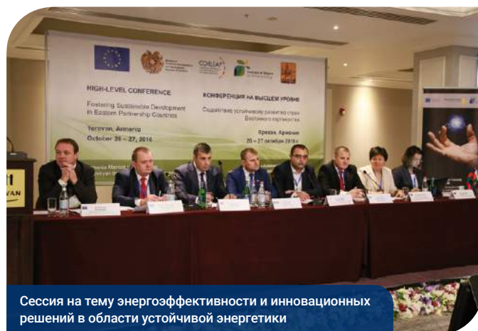
Сессия на тему энергоэффективности и инновационных решений в области устойчивой энергетики

Во время конференции участники поделились полученным опытом реализации энергоэффективных проектов в рамках программы «Демонстрационные проекты Соглашения мэров» (CoM-DeP) . Эти проекты направлены на поиск инновационных решений в области устойчивой энергетики на примере тепловой реабилитации зданий, модернизации систем уличного освещения, централизованного теплоснабжения и городского транспорта.