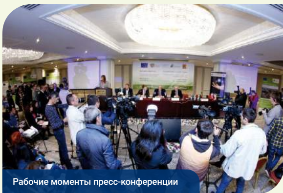
Рабочие моменты пресс-конференции

26 октября в большом конференц-зале гостиницы «Армения Мариотт» состоялась пресс-конференция для журналистов из Армении и других стран Восточного партнерства. Среди спикеров: Петр Освальд , член Совета г. Пльзень (Чешская Республика), Европейского комитета регионов и CORLEAP; Лоуренс Мередит , Директор департамента Восточного соседства Генерального директората Европейской комиссии по вопросам политики соседства и переговоров о расширении ЕС (DG NEAR), Европейская комиссия; Давид Ломян , Министр территориального управления и развития Республики Армения; Петр Антони Свитальский , Чрезвычайный и Полномочный Посол, глава представительства Европейского Союза в Армении. Мероприятие получило большой отклик как в национальных, так и международных СМИ, и было широко освещено в новостных ресурсах стран Восточного партнерства.